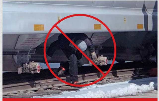
* Mejora la seguridad del operador; disminuye el riesgo de accidente