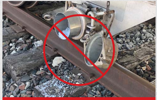
*Previene la pérdida de pellets; reduce el riesgo de multas